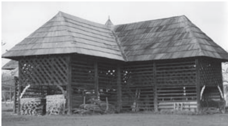
Foto 2: Marovškov kozolec je poseben tip topolarja, ki ima tlorisno obliko grškega križa s štirimi enakimi kraki, ki dimenzijsko nekoliko odstopajo. Z razvrstitvijo v križ pomeni izjemo in je edinstven primer v slovenskem in tudi širšem evropskem prostoru.

V letih 2001 in 2002 so dijaki pod mentorstvom Ivana Škodnika izdelali makete vseh dvanajstih topolarjev, ki so spomeniško zaščiteni. Makete so izdelane v merilu 1:20 in pri njih so uporabljeni enaki materiali kot so pri originalih, torej pri obstoječih objektih v naravi. Osnovni konstrukcijski material je les (smreka, macesen, hrast ...). V maketah so zajete in vidne vse značilnosti posameznih topolarjev, torej celotna konstrukcija, tesarske vezi, dekoracija čelnih sten in ostalih elementov.