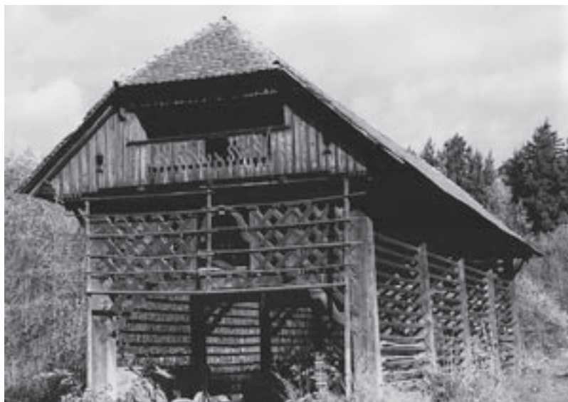
Foto 1: Pungartnikov topolar – različica z vdelanim »gankom« na zatrepni fasadi. (fotografija je starejšega datuma; lansko leto je bil »gank« obnovljen)

Dostop v osrednji del topolarja je največkrat speljan po notranjih stopnicah, ki so ob oknu; za spravilo krme pa so uporabljene štirioglate luknje v podu ali line v čelu stavbe.