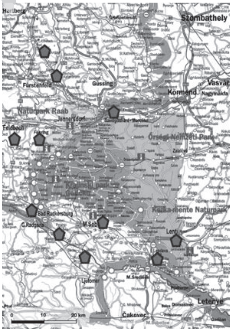
Krajinski park Goričko